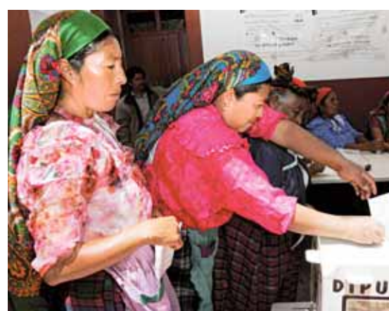
JORGE PLATA REUTERS