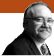
Josep-Lluís Carod-Rovira Diputat al Parlament de Catalunya

Josep-Lluís Carod sosté que la judeofòbia i la catalanofòbia van de bracet a Espanya i lamenta que Barcelona hagi sortit al mapa antisemita